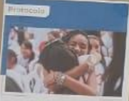
Protocolo Abordaje pedagógico del Consumo de Sustancias Psicoactivas en los entornos escolares.