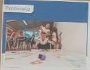
Protocolo Abordaje pedagógico de las Violencias Basadas en Género - VBG en los entornos escolares.