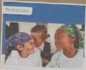
Protocolo Abordaje pedagógico de la Conducta Suicida en los entornos escolares.